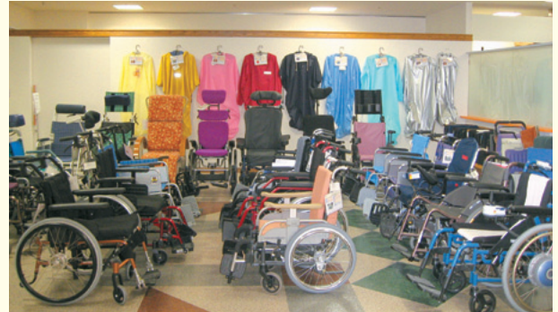
※学校の授業や事業所の研修などをご遠慮ください。