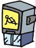
早期リハビリテーションの重要性