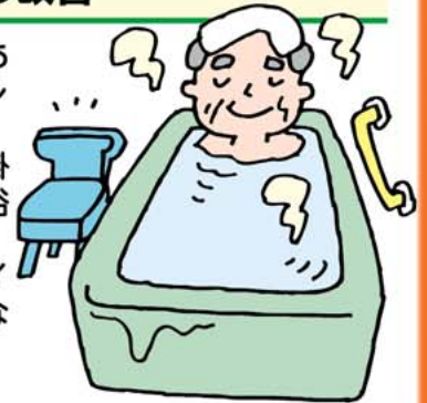
住環境の整備促進

我が国は世界でも有数の長寿国となりました。長生きできることは喜ばしいことですが、「寝たきりになったらどうしよう」「痴呆になったらどうなるのだろう」と思っている方も多くことでしょう。年をとるにつれて体の