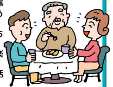
生活リハビリテーションの重要性