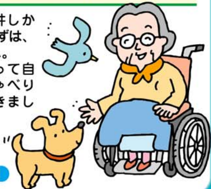
機器の積極的活用

寝ていては天井しか見えません。まずは、座って車椅子へ。ステッキをもって自然と人とおしゃべりをしに外へ行きましょう。